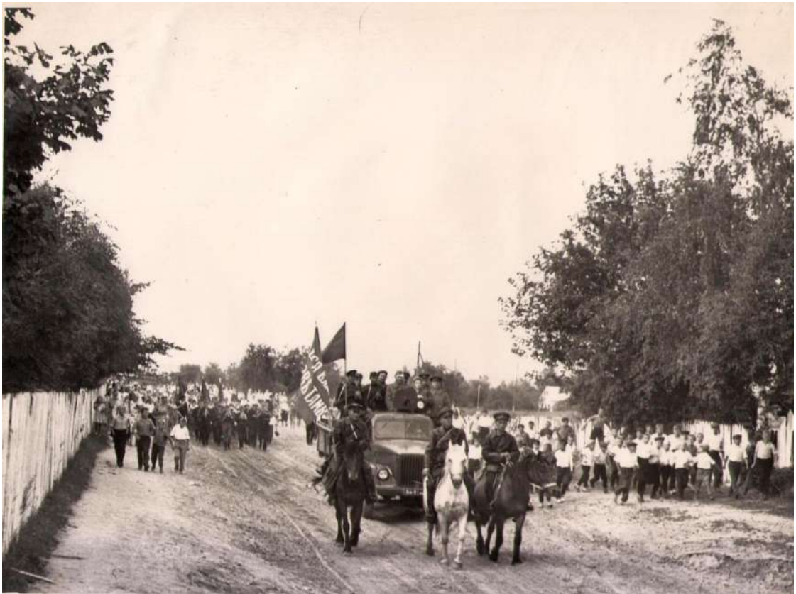
Святкаванне 40 годдзя калгаса імя Чкалава