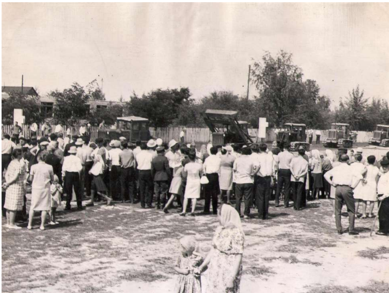
Выстава тэхнікі на свяце