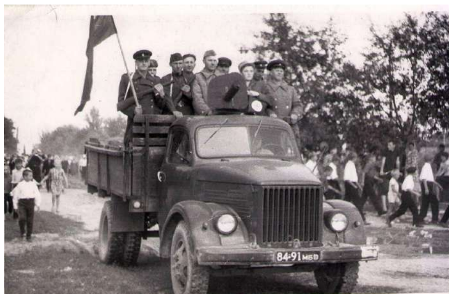
Святкаванне 40 годдзя калгаса імя Чкалава